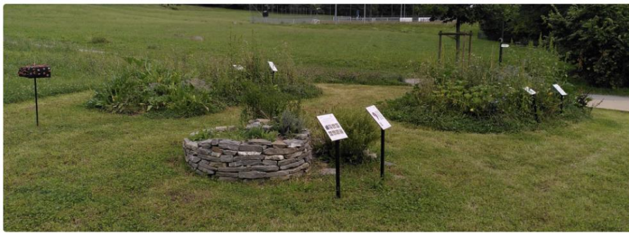
Une école grandeur nature